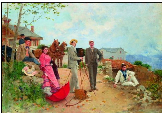
Francesc Miralles. La família Solà a Puigcerdà , 1893. Col·lecció particular.

fil argumental de la novel·la d'Oller, la mostra posa de manifest el gust d'aquesta classe social per l'art, així com els nous costums que aquesta incipient oferta cultural va generar. Les obres exposades esdevenen un compendi del seu gust, de l'art que més els agradava, i un excel·lent document històric per conèixer les escenes que protagonitzaren, els seus espais i els seus costums.