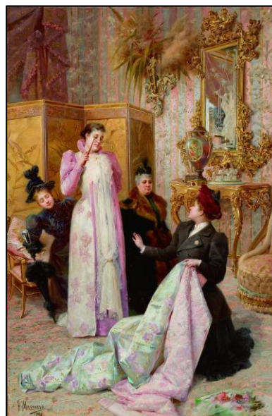
Francesc Masriera. La venedora de moda , 1894. Fundación María José Jové, A Coruña.

També descriu l'inevitable estiu fora de Barcelona, tant a la rodalia com al Pirineu, on les passejades elegants pel camp i la vila s'alternaven amb els banys marítims o termals. Dins la ciutat, els actes públics, com les estrenes al Liceu, les carreres de cavalls i les regates o els balls de disfresses, complementaven les activitats pròpies de cada gènere: els homes assistien als cafès, mentre que les dones anaven a comprar per adequar la seva llar i la seva imatge a l'última moda. El descans, el joc, la lectura o la contemplació artística eren també un senyal de pertinença de classe. La industrialització, els nous mitjans de transport i el consumisme comportaren l'aparició d'una nova cultura del lleure que s'escola fins a l'actualitat.