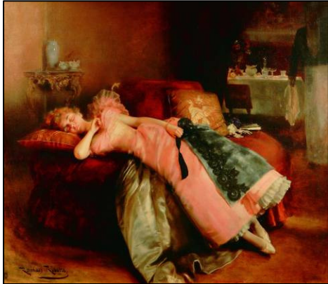
Romà Ribera. L'estirada , s. d. Col·lecció particular.

La segona part de La febre d'or fou escrita de manera una mica precipitada davant la certesa de la imminent publicació de l'obra de Zola amb una ambientació borsària idèntica. En la novel·la, Oller detalla la previsible fallida econòmica del protagonista, que acaba mentalment trastornat i socialment arraconat. Les escletxes morals del relat literari s'entreveuen també en les obres d'aquesta darrera secció.