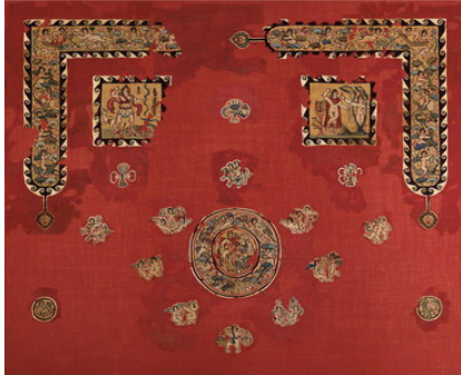
Xal de Sabina Antinoe. Segles IV-V