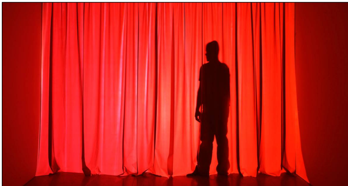
Douglas Gordon, Off Screen , 1998. Cortesía del artista y de Gagosian Gallery, Nueva York © Douglas Gordon. Fotografía de Simon Starling.