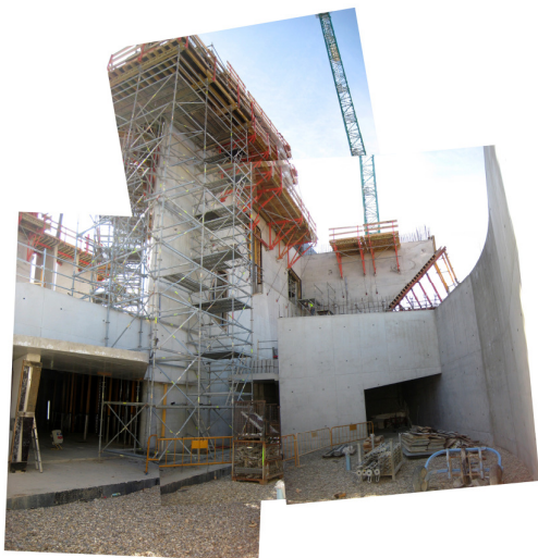
Levantamiento de los muros de CaixaForum Zaragoza. Cortesía del Estudio Carme Pinós

En el mes de septiembre de 2010, el presidente de "la Caixa" y de la Fundación "la Caixa", Isidro Fainé, presidió el acto de colocación de la primera piedra de CaixaForum Zaragoza. Ahora, poco más de un año y medio después, el proyecto comienza a ser una realidad, tal y como se ha podido comprobar en la visita que ha tenido lugar a las obras.