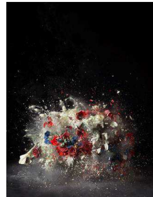
Ignace-Henri-Théodore Fantin-Latour, La exuberancia rosada de junio , 1886 © The National Gallery, Londres (izquierda); Adolphe Braun, Ramo de malvarrosa (Étude de fleurs) , c. 1857. Colección privada, cortesía de Hans P. Kraus Jr., Nueva York (centro); Ori Gersht, Blow Up: Sin título 5 , 2007. Colección de Robin and Peter Arkus, EE UU © Cortesía del artista y de Mummery + Schnelle, Londres (derecha)

Los fotógrafos contemporáneos han revisitado la tradición artística y han transportado al lenguaje fotográfico los iconos de la cultura occidental desde varios puntos de vista —de la emulación a la reinterpretación, pasando por la parodia y la crítica cultural— para desentrañar de forma sugerente y provocadora los contenidos subyacentes en las imágenes.