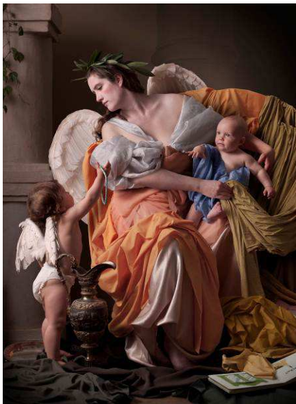
Maisie Broadhead, Que no pierdan dulzor , 2010. Sarah Myerscough Fine Art, Londres © Maisie Broadhead

Dentro de su programación cultural, la Obra Social "la Caixa" dedica una atención preferente a las manifestaciones artísticas más contemporáneas, como por ejemplo el cine y la fotografía; también a las relaciones entre el arte y la fotografía. A lo largo del siglo XX, pintores y escultores usaron la fotografía como herramienta auxiliar, pero también como medio de expresión artística. La fotografía ayudaba a fijar las composiciones y a dotar de realismo a las escenas, pero al mismo tiempo los artistas comprendieron las posibilidades expresivas de la nueva técnica y decidieron experimentar con ella con una clara voluntad estética.