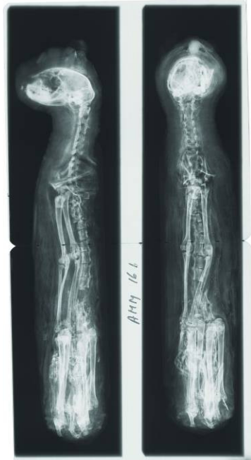
Radiografia de la mòmia de gat.

Les tecnologies modernes, desenvolupades sovint inicialment en el camp de la medicina, han permès que els científics i els arqueòlegs amplïïn els seus coneixements sobre les malalties, els hàbits alimentaris i les condicions de vida a l'antic Egipte. Una part de la mostra se centra en la manera com els estudiosos, els arqueòlegs i els científics han anat obtenint tota aquesta informació al llarg del temps. Tot i que les inscripcions dels sarcòfags han permès obtenir moltes dades, per aconseguir més informació a partir de les mòmies calia desembolicar-les, procés invasiu i destructiu. Avui dia, les tècniques no invasives, com ara les radiografies o diferents tipus d'escaneigs, permeten examinar les mòmies sense malmetre el cos.