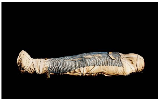
Mòmia d'Ankhhor. Tebes, Deir-el-Bahari, c. 625 aC.

La finalitat és subratllar els vincles entre el món antic i el món actual, i presentar la cultura com una realitat viva, fruit del coneixement i els intercanvis entre els