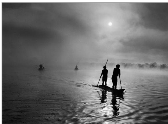
En la región del Alto Xingú, en el estado brasileño de Mato Grosso, un grupo de waurás pescan en el lago Piyulaga, cerca de su aldea. La población de la cuenca del Alto Xingú presenta una gran variedad étnica. Brasil. 2005.

Llega a CaixaForum Barcelona el proyecto de este fotógrafo brasileño, quien durante ocho años ha explorado la belleza de la naturaleza en todo el mundo