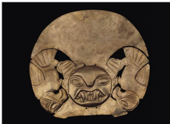
Corona con rostro de felino y guacamayos, mochica. Época Auge (1-800 d. C.). Museo Larco Herrera, Perú.