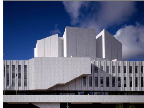
Alvar Aalto, Sala de conciertos y centro de convenciones. Finlandia, Helsinki, 1962-1971.