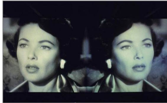
Douglas Gordon, La izquierda es correcta y la derecha es incorrecta, y la izquierda es incorrecta y la derecha es correcta, 1999. Colección "la Caixa" de Arte Contemporáneo.