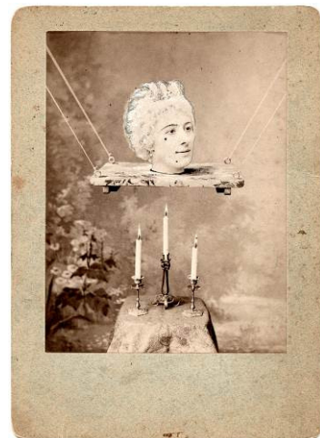
La source enchantée [ La fuente encantada ], 1892

Como es habitual, la Obra Social "la Caixa" ha preparado un completo y diverso programa de actividades relacionadas con Georges Méliès. La magia del cine . Además de la ya tradicional conferencia inaugural a cargo del comisario Laurent Mannoni y de un ciclo de conferencias sobre la figura del creador, se ha programado un ciclo de cine en