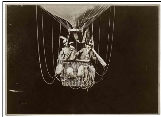
Vers les étoiles [Hacia las estrellas], 1906

Y es que la obra de Georges Méliès (1861-1938) aún es vigente hoy día, en especial en las producciones de los grandes creadores de Hollywood, porque, como afirmaba él mismo en 1933, «¿quién puede vivir sin féerie , sin un poco de fantasía?». La película La invención de Hugo (2011), con la que Martin Scorsese le rendía un merecido homenaje, ha vuelto a situar en primer plano la vida y la obra de Méliès.