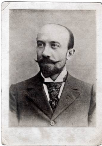
Georges Méliès en 1895, a los 34 años de edad

A finales de 1895 descubrió el cinematógrafo de los hermanos Lumière, que le cautivó. Cuando ellos se negaron a venderle su aparato, Méliès recorrió a un óptico londinense, Robert William Paul, que había inventado una cámara. A su regreso a París rodó sus primeras cintas, y en mayo de 1896 empezó a realizar sus primeras películas trucadas, como Le manoir du diable ( La mansión del diablo ) y Escamotage d'une dame chez Robert-Houdin ( Desaparición de una dama en el Robert-Houdin ).