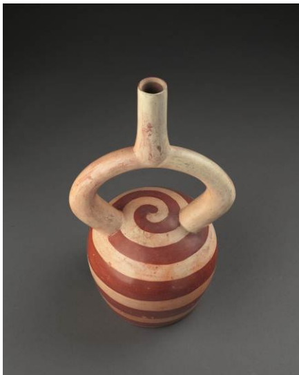
Recipient cerimonial amb dissenys escalonats i espirals. Mochica, 100-800 dC.

El 1532, els conqueridors espanyols, liderats per Francisco Pizarro, van arribar a l'Amèrica del Sud i van trobar que una gran part d'aquest vast territori era sota el govern dels emperadors inques. La difusió que d'aquesta cultura van fer cronistes, sacerdots, visitadors i administradors colonials va fer que la cultura