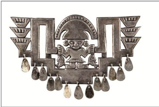
Adorn per al nas que representa un ancestre divinitzat sobre una estructura escalonada. Chimú, 1100-1470 dC

Les exposicions que l'Obra Social "la Caixa" dedica des de fa anys a les grans cultures del passat tenen com a missió mostrar al públic les diferents maneres en què homes i dones de diversos llocs i èpoques s'han enfrontat a les grans qüestions universals, així com ampliar les perspectives sobre el món a partir de les investigacions històriques i arqueològiques més recents.