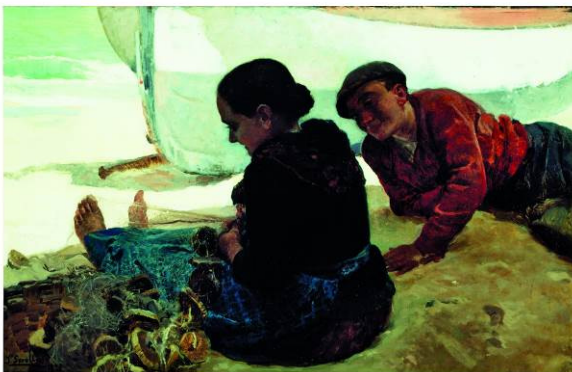
Joaquín Sorolla, El pillet de platja , 1891. Oli sobre tela.