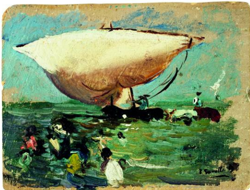
Joaquín Sorolla, Entrant la barca, 1902. Oli sobre cartró.

Emmarcat en aquest moment especial en la història de l'art, Joaquín Sorolla representa un dels noms essencials de la pintura espanyola, i per això l'entitat es complau a poder presentar una exposició que ens descobreix aspectes nous de la seva producció que ajuden a ressaltar la seva importància.