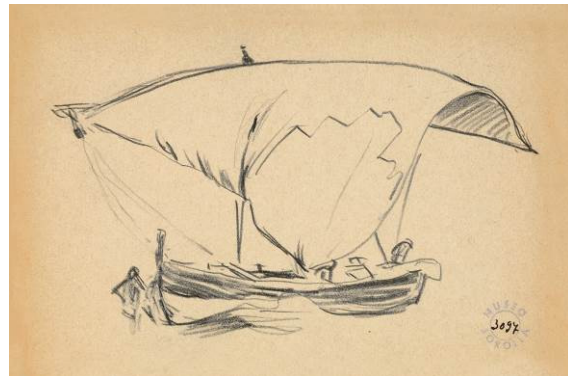
Joaquín Sorolla, Barca amb la vela desplegada, 1895-1897. Carbonet sobre paper continu satinat.