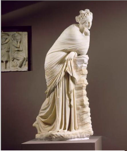
Polímnia, Col·lecció Borghese, marbre, segles I-II dC. Museu del Louvre.

La figura traça una àmplia línia històrica: copiada d'un original grec per part d'un artista romà, va ser completada per l'escultor italià del segle XVIII Agostino Penna per decorar