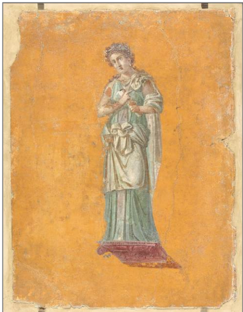
Cal·líope, fresc, segle I dC. Museu del Louvre.

Es tracta d'una mostra excepcional de caràcter arqueològic dedicada a la imatge de la dona en la decoració domèstica romana a partir de les col·leccions del Museu del Louvre. La mostra s'emmarca en la línia expositiva de l'Obra Social "la Caixa" dedicada a les grans cultures del passat.