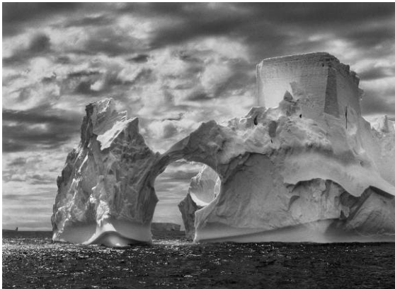
Iceberg entre l'illa Paulet i les illes Shetland del Sud, al mar de Weddell. Prop de la superfície, els nivells de flotació anteriors són clarament visibles en el glaç, que el moviment constant de l'oceà ha anat polint. Dalt de tot, una forma semblant a la torre d'un castell ha estat tallada per l'erosió eòlica i les peces adossades de glaç. Península Antàrtica. Gener i febrer del 2005.

A finals del 1990, després de fotografiar durant unes quantes dècades arreu del món les grans transformacions demogràfiques i culturals del nostre temps, Sebastião Salgado va tornar al seu lloc natal, una finca ramadera a la vall del riu Doce, a l'estat de Minas Gerais, al Brasil. Les terres abans fèrtils, envoltades de vegetació tropical, amb una exuberant diversitat d'espècies vegetals i animals, havien estat víctimes d'un procés de desforestació i erosió. La naturalesa semblava esgotada. La seva dona, Lélia Wanick Salgado, va tenir la idea de replantar un bosc amb les mateixes espècies autòctones, recreant l'ecosistema que Salgado havia conegut de nen. A poc a poc els animals van anar tornant, fins que es va aconseguir un renaixement complet de la zona. Actualment la finca és un espai protegit.