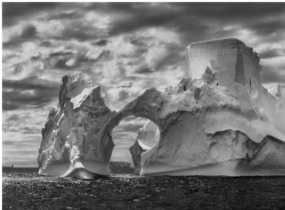
Iceberg entre l'illa Paulet i les illes Shetland del Sud, al mar de Weddell. Prop de la superfície, els nivells de flotació anteriors són clarament visibles en el glaç, que el moviment constant de l'oceà ha anat polint. Dalt de tot, una forma semblant a la torre d'un castell ha estat tallada per l'erosió eòlica i les peces adossades de glaç. Península Antàrtica. Gener i febrer del 2005.