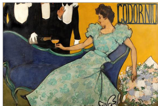
RAMON CASAS CARBÓ Ámbar y espuma , 1898 Colección Codorniu

El mes de enero del año 1897 abre sus puertas en Barcelona la cervecería Els Quatre Gats . El local de la calle Montsió fue el centro irradiador de un modelo cultural alternativo dedicado a incentivar y estimular la libertad y la creatividad artística, siguiendo el modelo del famoso cabaret parisino Le Chat Noir , en el cual se reflejó. El espacio reunió, durante sus seis años de funcionamiento, todo tipo de