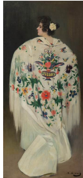
RAMON CASAS CARBÓ A los toros , c. 1896 Colección particular

De la misma forma, todo este material también nos acerca a la influencia formal y compositiva que la fotografía ejerció sobre la obra de Casas. Los encuadres, los puntos de vista, las visiones aéreas son algunos de los préstamos incorporados por el pintor.