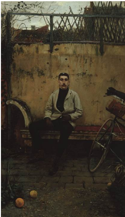
SANTIAGO RUSIÑOL PRATS Ramon Casas velocipedista, 1899 Colección Banc Sabadell

Dentro de su programación cultural, la Obra Social "la Caixa" presta especial atención al arte de los siglos XIX y XX con el objetivo de promover la divulgación en torno a una época clave para entender la sensibilidad contemporánea. En este sentido, la figura de Ramon Casas tiene un evidente protagonismo. Como gran figura del Modernismo, representa el referente más claro del arte realizado en Cataluña en el fértil periodo de finales del siglo XIX y principios del XX.