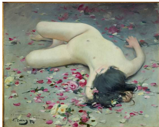
RAMON CASAS CARBÓ Flores deshojadas , 1894 Colección Ruiz Gallardón Albéniz

Gran especialista en el cultivo del género del retrato, Casas convirtió la imagen de la mujer en uno de los motivos artísticos más habituales de su trayectoria profesional. Las obras expuestas incluyen una diversidad tipológica suficientemente representativa de los diferentes modelos en los cuales fundamentó la búsqueda del ideal estético de belleza femenina, aunque predomina el perfil de la mujer sofisticada, refinada, elegante y coqueta, mucho más próxima al decorativismo del estilo 1900. Esta ambientación de sofisticación, lujo y riqueza nos sumerge en una sociedad que tiene el hedonismo y el culto al placer esteticista como valores muy estereotipados del decadentismo de finales del siglo XIX. Sin embargo, junto a este arquetipo, deudor de la pintura anecdotista y de la sensualidad orientalista, también emerge, como reclamo publicitario, un modelo de mujer emancipada, activa, que tiene un papel más acorde con la vida moderna y a quien le gustan actividades como la lectura o el deporte, alejadas de la imagen tradicional. De la misma manera, las series de desnudos realizados durante la década de 1890 devienen uno de los episodios pictóricos más libres y estimulantes de Casas. En términos formales, se trata de ejercicios que superan las convicciones academicistas y derivan en propuestas de gran atrevimiento formal y de una gran fuerza visual.