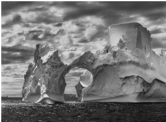
Iceberg entre l'illa Paulet i les illes Shetland del Sud, al mar de Weddell. Prop de la superfície, els nivells de flotació anteriors són clarament visibles en el glaç, que el moviment constant de l'oceà ha anat polint. Dalt de tot, una forma semblant a la torre d'un castell ha estat tallada per l'erosió eòlica i les peces adossades de glaç. Península Antàrtica. Gener i febrer del 2005.