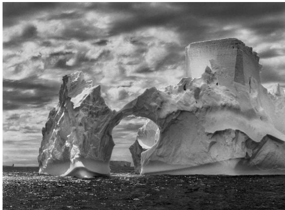
Iceberg entre l'illa Paulet i les illes Shetland del Sud, al mar de Weddell. Prop de la superfície, els nivells de flotació anteriors són clarament visibles en el glaç, que el moviment constant de l'oceà ha anat polint. Dalt de tot, una forma semblant a la torre d'un castell ha estat tallada per l'erosió eòlica i les peces adossades de glaç. Península Antàrtica.