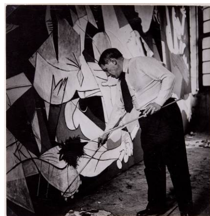
Dora Maar. Picasso dret treballant en el Guernica al seu taller de Grands-Augustins © Museo Nacional Centro de Arte Reina Sofía

Picasso. El viatge del Guernica proposa un recorregut històric de l'obra de Picasso des de la seva creació a París el 1937 fins al seu emplaçament permanent al Museo Nacional Centro de Arte Reina Sofía el 1992. Els visitants podran descobrir el procés creatiu que va seguir el cèlebre artista espanyol per executar aquesta obra, i també el seu significat de denúncia antibèlica i els motius pels quals l'obra va viatjar per tot el món durant més de quaranta anys.