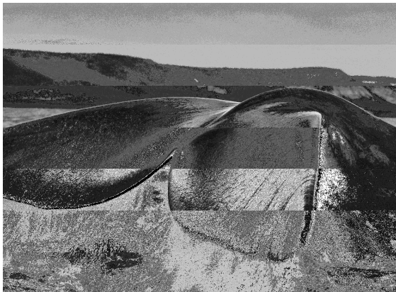
Les balenes franques australs ( Eubalaena australis ), atretes a la península Valdés pel recer que brinden els seus dos golfs, el de San José i el Nuevo, acostumen a nedar amb la cua dreta i fora de l'aigua. Península Valdés. Argentina. 2004.

L'exposició, comissariada per Lélia Wanick Salgado, està formada per 38 fotografies en un èpic blanc i negre que són el testimoni d'una llarga coexistència dels humans amb la naturalesa, i una oda visual a un món que hem de protegir.