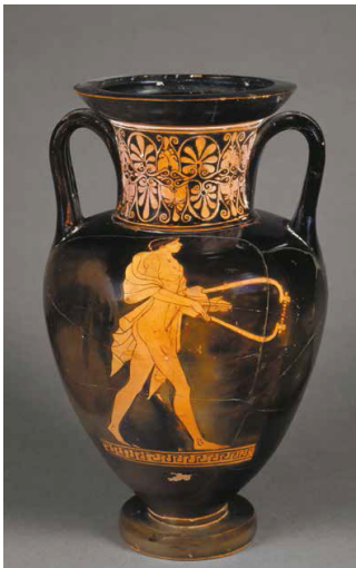
Ánfora ática de figuras rojas: joven tocando el bárbiton. Atenas, atribuida al Pintor de Berlín. Hallada en Capua, Italia, c. 480-470 a. C. París, Musée du Louvre.