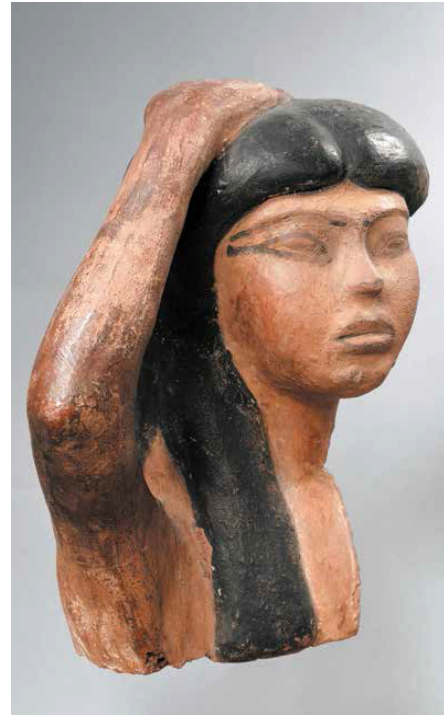
Estatua fragmentaria: busto de plañidera. Egipto, Imperio Nuevo, principios de la dinastía XVIII, 1550-1425 a. C. París, Musée du Louvre