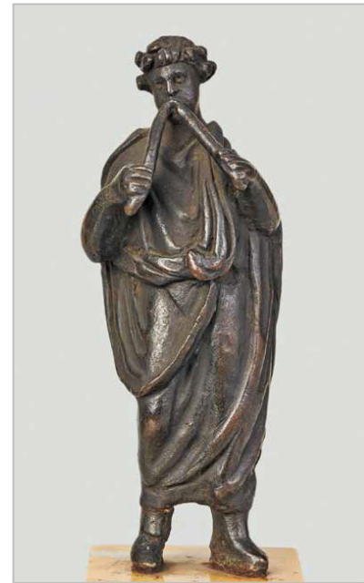
Figurita de tibicen , músico tocando el oboe doble. Italia. Mediados del siglo I d. C. París, Bibliothèque nationale de France.

Músicas en la antigüedad es fruto del acuerdo entre la Obra Social "la Caixa" y el Musée du Louvre para la organización conjunta de exposiciones que acerquen o descubran al público artistas, colecciones y periodos de la historia del arte a partir de los fondos del museo parisino. Esta exposición sigue la línea de otros proyectos que se han desarrollado conjuntamente con el Musée du Louvre, como los dedicados al Egipto faraónico, las rutas de Arabia, los príncipes etruscos, Mesopotamia, Delacroix y Le Brun.