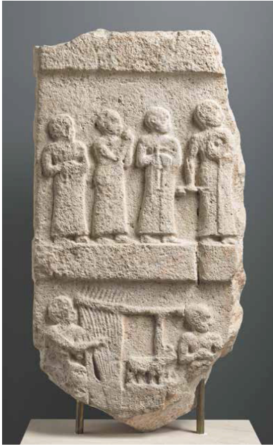
Estela conocida como Estela de la música . Tello, Irak. Época neosumeria, 2140-2110 a. C. París, Musée du Louvre.

Desde Irán hasta la Galia, los vestigios milagrosamente conservados de instrumentos, los fragmentos de notaciones musicales y las múltiples representaciones de intérpretes que han llegado hasta nuestros días evocan los sonidos de tres mil años de historia (del 2900 a. C. al 395 d. C.). La exposición reúne un conjunto de piezas singulares, de sensible y delicada belleza: instrumentos y escenas reproducidas en tres dimensiones en vasos griegos, mosaicos y monedas.