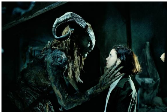
El laberinto del fauno , 2006. Guillermo del Toro

La exposición está dividida en siete secciones: Alegría, Rabia, Risas, Lágrimas, Miedo, Valentía e Ilusión . Son emociones que sentimos a lo largo de la vida, pero que afrontamos por primera vez en la infancia, momento en el que estas experiencias, gracias a su carácter nuevo y desconocido, se viven con especial intensidad. Cada una de las secciones gira en torno a un vídeo