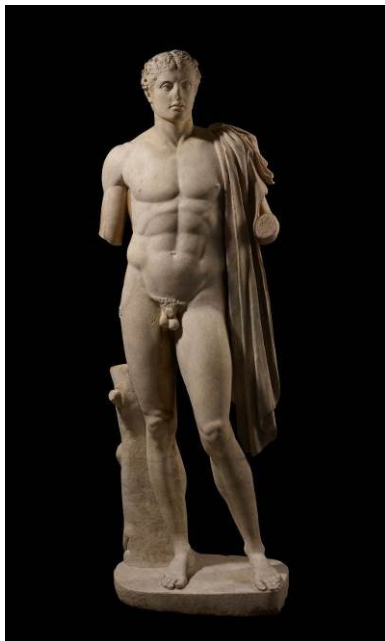
Herói o atleta. Estàtua de marbre. Romana (segle I dC) a partir d'un original grec (c. 320-300 aC).