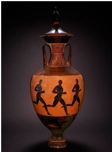
Corredors en una àmfora trofeu. Àmfora trofeu de ceràmica de figures negres. 333-332 a. C. Feta a Atenes. Trobada a Bengasi, Cirenaica, Líbia.

Aquesta exposició és la segona d'una sèrie de quatre projectes conjunts entre l'Obra Social "la Caixa" i el British Museum. Aquesta cooperació és fruit de la voluntat de totes dues institucions de promoure el coneixement a partir de l'organització de grans projectes expositius presentats conjuntament a partir de les col·leccions britàniques.