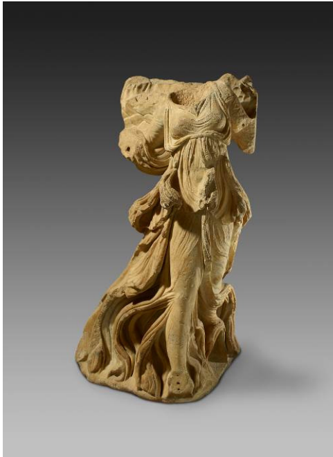
Niké alada amb la roba agitada pel vent. Estàtua de marbre, c. 100. aC. Halicarnàs.

Niké, la deessa de la victòria que connecta el món dels mortals amb el món dels déus, dona la benvinguda a l'exposició, que convida a descobrir la idea de