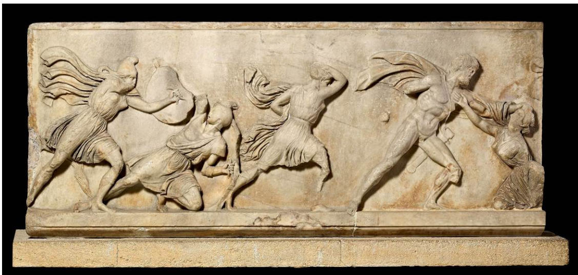
Bloc d'un fris amb una batalla entre grecs i amazones. Relleu de marbre. c. 350 aC. Trobat al mausoleu d'Halicarnàs, actual Turquia.

És el cas de la part final de la mostra, que aprofundeix en el tema de la mort a través de les escultures del mausoleu d'Halicarnàs, la tomba del rei Mausol, una de les set meravelles del món antic. El British Museum no havia cedit mai abans en préstec aquestes cèlebres i emblemàtiques escultures, que a més han estat restaurades per a l'ocasió.