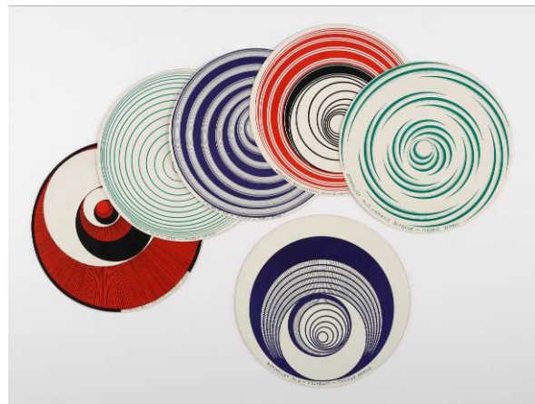
Marcel Duchamp, Optical Disc (Rotorelief) (Disco óptico [Rotorrelieve]), 1935

Así, la propuesta expositiva reúne a algunas de las primeras figuras de la escena creativa de las primeras décadas del siglo XX: Marcel Duchamp, Man Ray, Joan Miró, Joaquín Torres-García, George Grosz, Francis Picabia, Paul Klee, Alexander Rodchenko, Valentina Kulagina, El Lissitzky, László Moholy-Nagy, Julio González, Jean Arp, Constantin Brancusi, Alexander Calder, Arshile Gorky y Josep Renau, entre otros.