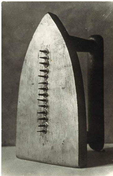
Man Ray, Le cadeau (El regalo), 1921. Gelatina de plata sobre papel. © Man Ray Trust, VEGAP, Barcelona, 2017

Esta revisión de la colección incluye un amplio número de obras centradas en visiones poéticas y oníricas, estrechamente relacionadas con los movimientos dadaístas y surrealistas. Por otro lado, un gran grupo de obras abarcan un conjunto de prácticas artísticas de orden analítico materializado en formas abstractas, situando como clara referencia a Marcel Duchamp. Estas dos líneas van acompañadas de un significativo número de creaciones vinculadas al arte de la propaganda, la crítica social y el compromiso político que tuvo en el fotomontaje un instrumento de intervención plástica de primer orden.