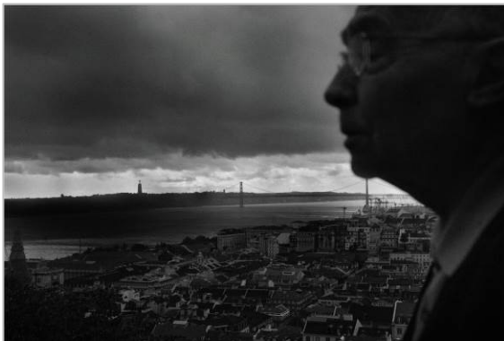
José Saramago.

En esta ocasión, la Obra Social "la Caixa" presenta Paseos de Nobel , que presenta el proyecto —iniciado en 2005 y aún en curso— del fotógrafo Kim Manresa y el periodista Xavi Ayén para entrevistar a todos los premios Nobel de literatura en sus lugares de residencia o en los escenarios de sus obras.