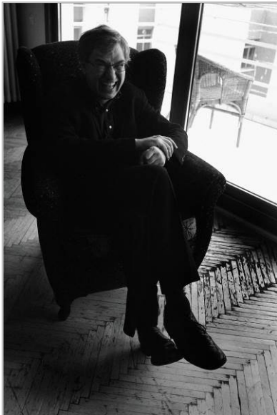
Orhan Pamuk.

El resultado es un trabajo único e irrepetible reconocido por la Academia Sueca, que lo ha incorporado al Museo Nobel de Estocolmo. El estilo de Kim Manresa, espontáneo, dinámico y alejado de las poses de estudio, destaca la