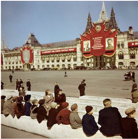
Robert Capa, Jóvenes esperando para ver la tumba de Lenin en la Plaza Roja, Moscú, 1947. © Robert Capa International Center of Photography / Magnum Photos

Contemplar la carrera de Capa a través de estas fotografías en color nos hace percibir de nuevo la tenacidad con la que ejercía como fotoperiodista en un campo dominado por el blanco y negro. Se trata de una parte de su obra que sigue siendo, en lo fundamental, desconocida.