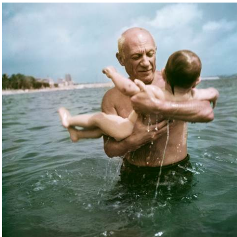
Robert Capa, Pablo Picasso playing in the water with his son Claude, Vallauris, Francia, 1948.