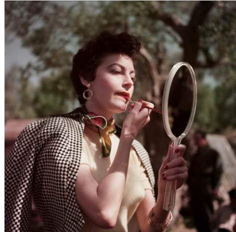
Robert Capa, Ava Gardner en el rodaje de The Barefoot Contessa ( La condesa descalza ), Tívoli, Italia, 1954.

La muestra recoge también ejemplares de revistas como Life o Illustrated , que publicaban regularmente sus imágenes, incluidas numerosas portadas, y reportajes para plumas ilustres, como el que realizó para A Russian Journal , de John Steinbeck. Este escritor dijo de Capa: «Sus fotografías no son accidentes, y la emoción que reside en ellas no es azarosa. Capa podía fotografiar el movimiento, la felicidad, el desengaño. Podía fotografiar el pensamiento».