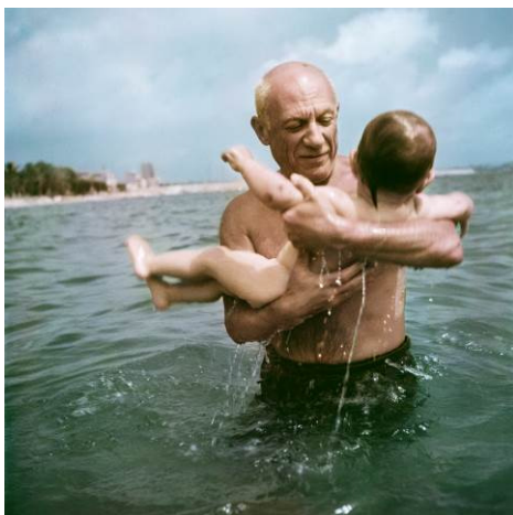
Robert Capa, Pablo Picasso jugando en el agua con su hijo Claude, Vallauris, Francia, 1948.