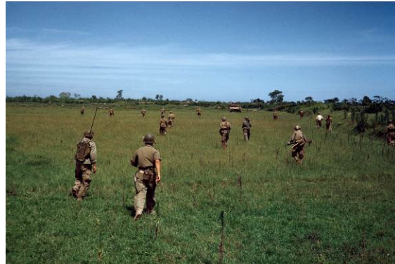
Robert Capa, Carretera de Nam Dinh a Thài Binh , Indochina (Vietnam), mayo 1954. © Robert Capa / International Center of Photography / Magnum Photos

Excepcional testigo de los acontecimientos de su tiempo, Capa fue, sobre todo, un gran contador de historias. Sus fotografías bélicas no se limitaron a registrar los momentos de conflicto, sino que también se centraban en las personas, civiles y soldados, antes, durante y después de la batalla. Le interesaba comprender la situación con la gente del lugar, con quien establecía una fuerte conexión: conocía a las personas, hablaba con ellas, era invitado a sus casas... Esta concepción del oficio fotográfico, de gran implicación en sus temas y de prodigiosa capacidad narrativa, se esconde también detrás de la galería de fotos en color que Capa dedicó a la vida animada y de ocio en los años de la posguerra.