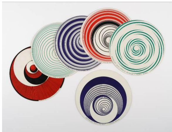
Marcel Duchamp, Optical Disc (Rotorelief) (Disc òptic [Rotorelief]), 1935 © The estate of Marcel Duchamp / VEGAP, 2017

En col·laboració amb l'Institut Valencià d'Art Modern (IVAM), Les avantguardes històriques 1914-1945. Construïnt nous mons ofereix una relectura de les primeres dècades del segle XX a través d'una acurada selecció d'obres de la col·lecció del centre valencià, una de les millors sobre les avantguardes de tot Europa, juntament amb una selecció procedent de la Col·lecció Alfaró Hofmann.