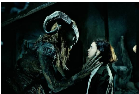
El laberinto del fauno , 2006. Guillermo del Toro

La exposición está dividida en siete secciones: Alegría, Rabia, Risas, Lágrimas, Miedo, Valentía e Ilusión . Son emociones que sentimos a lo largo de la vida, pero que afrontamos por primera vez en la infancia, momento en el que estas experiencias, gracias a su carácter nuevo y desconocido, se viven con especial intensidad. Cada una de las secciones gira en torno a un vídeo