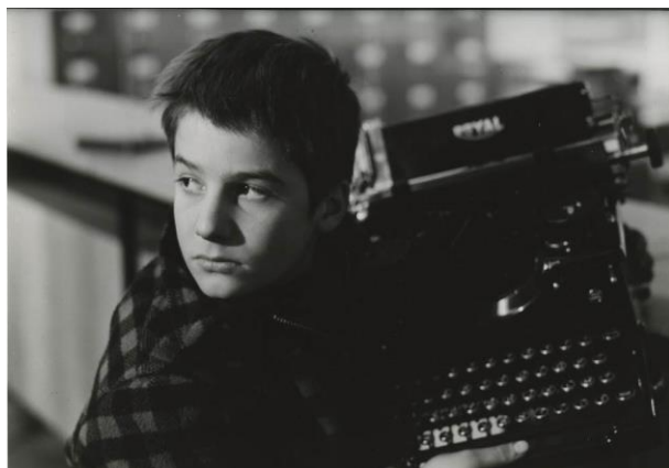
Les 400 coups , 1959. François Truffaut