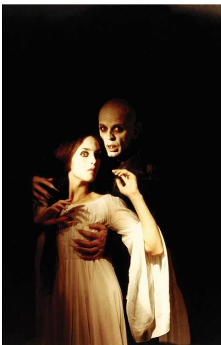
Isabelle Adjani y Klaus Kinski en Nosferatu de Werner Herzog. Producción: Gaumont (Francia) / Werner Herzog Filmproduktion (Alemania), 1979

Dentro de su programación cultural, ”la Caixa” dedica una atención preferente a las manifestaciones artísticas fundamentales en la formación de la sensibilidad contemporánea. En esta línea se enmarcan las exposiciones dedicadas al cine, que, junto con la fotografía, constituye una de las formas artísticas más características del siglo xx. Así, la entidad ha dedicado muestras retrospectivas a grandes nombres del mundo del cine, como por ejemplo los directores Charles Chaplin, Federico Fellini y Georges Méliès, y a compañías pioneras como Pixar o Disney. Gracias a la colaboración con La Cinémathèque française de París, se presentaron con anterioridad proyectos conjuntos como Georges Méliès. La magia del cine; Arte y cine. 120 años de intercambios y Cine y emociones. Un viaje a la infancia .