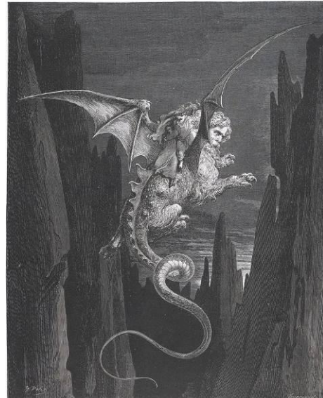
Gustave Doré. Il·lustració per a L'infern de Dante Alighieri. © Bibliothèque Nationale de France

Al segle XVIII, les històries de vampirs procedents de zones rurals de l'Europa de l'Est i Grècia arriben a oïda de filòsofs il·lustrats com Voltaire i Rousseau, que discuteixen sobre el seu significat i importància. Goya, en el seu art a cavall entre la Il·lustració i el Romanticisme, representa monstres amb ales de ratpenat a les seves estampes. Va ser al segle XIX quan el mite va irrompre amb força en la literatura gòtica, amb obres seminals com El vampir (1819), de J. W. Polidori, basada en un relat inacabat de Lord Byron, i Carmilla (1872), de Joseph Sheridan Le Fanu.