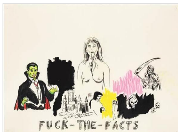
Wes Lang. Fuck the Facts , 2019.

També s’hi inclouen obres de la Col·lecció ”la Caixa” d’Art Contemporani que reflexionen sobre aquesta figura, a càrrec d’artistes com Jean-Michel Basquiat o Cindy Sherman, així com altres peces encarregades especialment per a aquesta exposició a artistes com Wes Lang o Claire Tabouret. Així mateix, en la mostra es pot gaudir de 15 muntatges audiovisuals temàtics, amb fragments de 60 pel·lícules i sèries televisives.