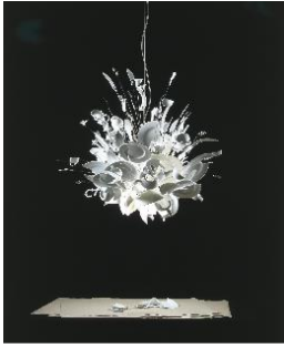
Ingo Maurer, Porca Miseria! , 1994 © Ingo Maurer GmbH, Munic

fil de l'exposició Objetes de disig. Surrealisme i disseny, 1924-2020 , inaugurada recentment a Barcelona.