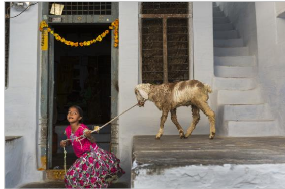
Una nena juga amb un xai a Bukaraya Samudram durant la festivitat del Teru.

La mostra aprofundeix en el més sensible i màgic del món femení, com també en la força i la capacitat de superació de les dones d'Anantapur. La fotografia s'hi ha apropat amb un respecte reverencial. Obstinada i desmesurada, García Rodero ha sabut submergir-se en aquest món i fondre's en l'alegria i el patiment de les persones que encobreixen amb color i distinció els clarobscurs de la seva pròpia existència.