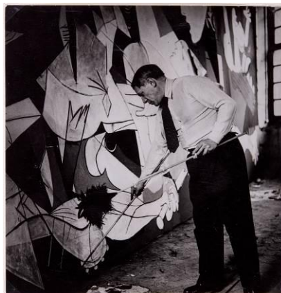
Dora Maar. Picasso de pie trabajando en el Guernica en su taller de Grands-Augustins. © Museo Nacional Centro de Arte Reina Sofía.

Picasso. El viaje del Guernica propone un recorrido histórico de la obra de Picasso desde su creación en París en 1937 hasta su emplazamiento permanente en el Museo Nacional Centro de Arte Reina Sofía, en 1992. Los visitantes podrán descubrir el proceso creativo que llevó a cabo el célebre artista español para realizar su obra, así como su significado de denuncia antibélica y los motivos por los que la obra viajó por todo el mundo durante más de cuarenta años.