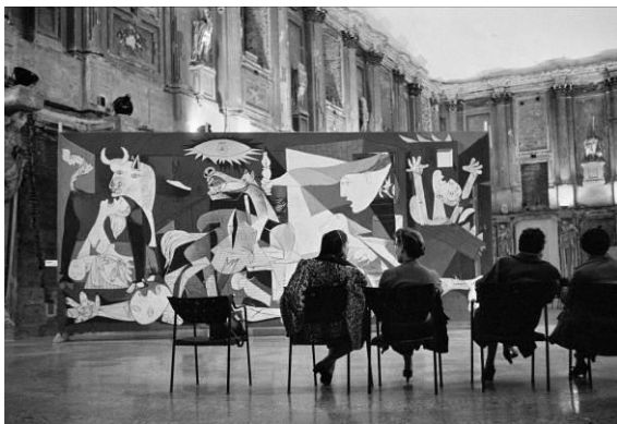
Foto de la sala del Guernica .

Los distintos espacios y recursos expositivos de la muestra descubren el contexto histórico de la época, así como las claves para entender la importancia y el significado del Guernica . La exposición incluye audiovisuales, reproducciones fotográficas y de carteles de la época, y facsímiles de documentos y dibujos que pretenden explicar la historia de la creación y los viajes de una de las obras más representativas del artista más importante del siglo xx.