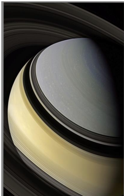
Panorámica sobre las regiones septentrionales de Saturno. Los anillos proyectan una franja de sombra sobre este mundo gigante gaseoso. Cassini, 20 de enero de 2007.