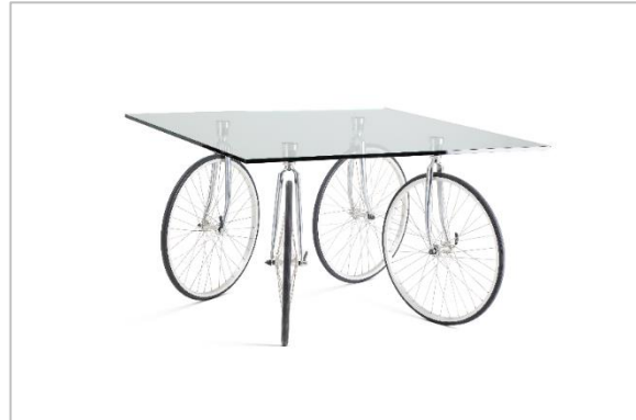
Gae Aulenti, Tour , 1993

Desde los años sesenta, la producción de numerosos tipos de plásticos permitió diseñar muebles con cualquier forma imaginable. Muchas de las piezas de mobiliario creadas por los miembros del movimiento de diseño radical italiano tienen proporciones absurdas y formas fantásticas, inspiradas directamente en la obra de los surrealistas. Por otro lado, los artistas surrealistas no abandonan el diseño