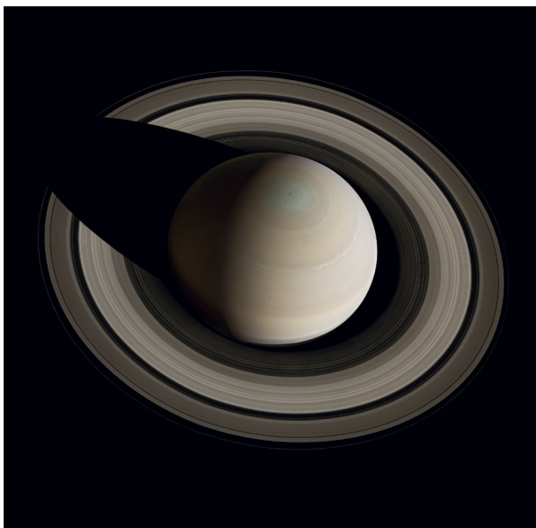
Por encima del polo norte de Saturno, fotografía compuesta en mosaico. Cassini, 10 de octubre de 2013.