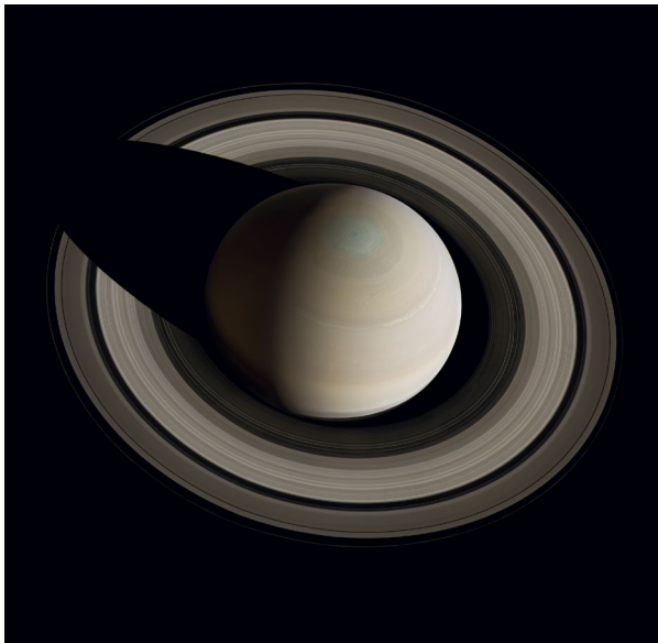
Por encima del polo norte de Saturno, fotografía compuesta en mosaico. Cassini, 10 de octubre de 2013.