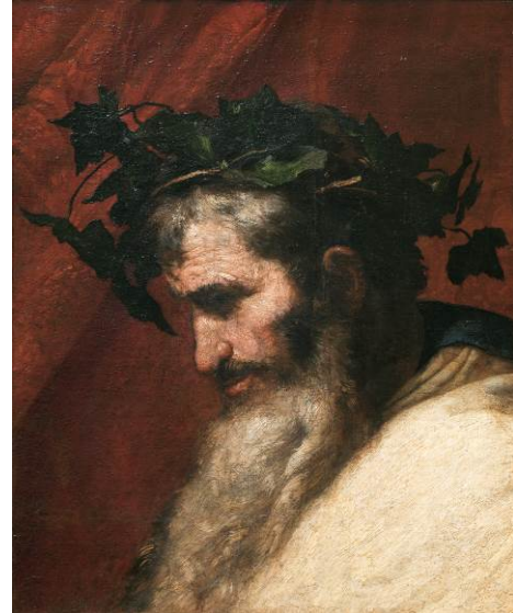
José de Ribera, Detall del cap del déu Bacus, 1636. Oli sobre tela.