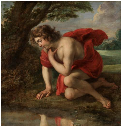
Jan Cossiers, Narcís, 1636-1638. Oli sobre tela.

Zeus va contraure diversos matrimonis i va tenir innumbrables aventures amb diferents deesses, nimfes, dones mortals i, fins i tot, algun jove efèbus. D'aquestes relacions van néixer alguns dels principals déus de l'Olimp, altres divinitats menors —les hores, les moires, les gràcies, les muses...— i, també, destacats herois, com ara Perseu i Hèracles, entre d'altres.