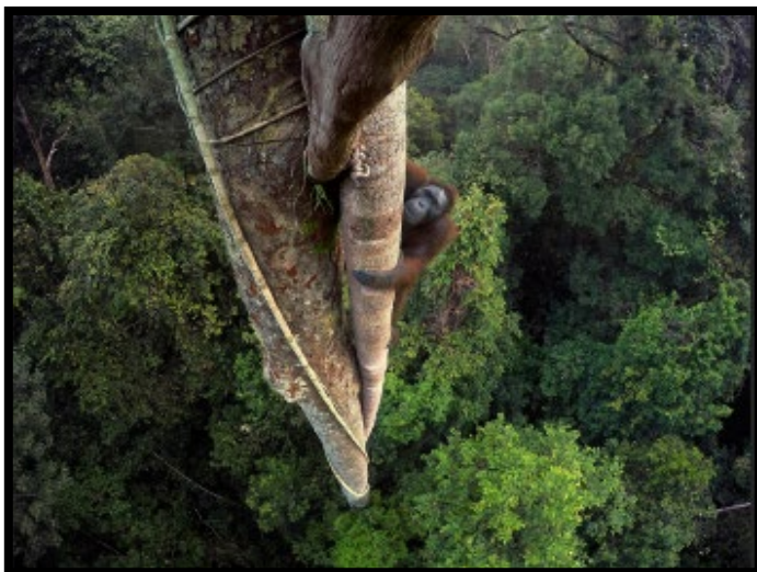
Kalimantan, Borneo, Indonesia.

A 30 metros del suelo, este orangután de Borneo trepa en busca de unos preciados higos. Los orangutanes crean un mapa mental de la selva, y recuerdan cuándo y dónde encontrar fruta madura. Indonesia pierde cada año miles de hectáreas de sus bosques tropicales debido a la tala y a las plantaciones de palma aceitera, lo que pone en