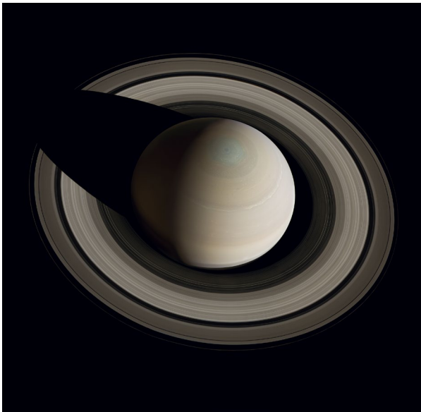
Por encima del polo norte de Saturno, fotografía compuesta en mosaico. Cassini, 10 de octubre de 2013.