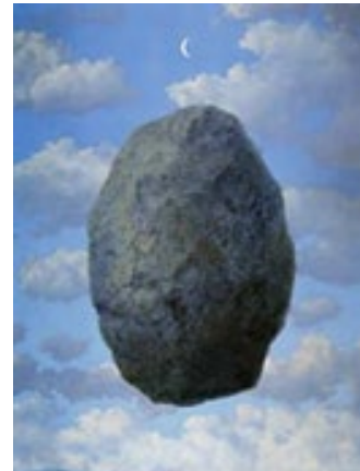
El sentit de les realitats , 1963. © René Magritte, VEGAP, Barcelona, 2022

Comissariada per Guillermo Solana, director artístic del Museu Nacional Thyssen-Bornemisza, la present retrospectiva reuneix 69 pintures procedents d'institucions, galeries i col·leccions particulars de més de 55 prestadors dels Estats Units, el Canadà, el Japó o Europa, entre altres països, gràcies al suport de la Fundació Magritte i del seu president, Charly Herscovici. Entre aquestes obres, destaquen La cascada (1961), L'alta societat (1965-1966), El llum filosòfic (1936), Temptativa de l'impossible (1928), Deliris de grandesa (1948), El somni (1945), La violació (1945), La sala d'escolta (1958), La clau dels camps (1936), El gran segle (1954) o el quadre El sentit de les realitats (1963), que viatja des del Museu d'Art de la Prefectura de Miyazaki del Japó i només es podrà veure a CaixaForum Barcelona.