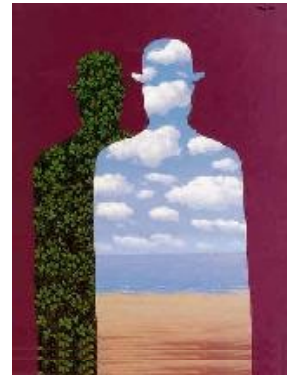
L'alta societat, 1965 o 1966. © Gentilesa de Fundación Telefónica. Gentilesa de Ludion Publishers © René Magritte, VEGAP, Barcelona, 2022

La producció de collages i papiers collés no ocupa un gran espai en el conjunt de l'obra de Magritte, i malgrat això, la seva influència es veu per tot arreu en la seva pintura i, en conseqüència, també al llarg de tota l'exposició. El primer pas del collage és retallar, i el retall genera gran part de les imatges de Magritte per crear un món aparedat, estratificat, compartimentat, plans que en part amaguen i en part en revelen d'altres que hi ha més enllà.