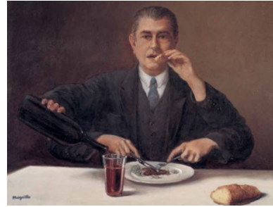
El mag, 1951. Esther Grether Family Collection.

Aquest espai reuneix tres dels quatre autoretrats coneguts de Magritte, en els quals explora les possibilitats de l'artista com a mag i alhora suggereix una actitud irònica envers els mites relacionats amb el geni creador. Magritte no tenia cap interès a descriure la seva fisonomia ni a explicar la seva vida a través d'aquestes obres. Els seus autoretrats són pretextos per introduir en el quadre la figura de l'artista i el procés de creació .