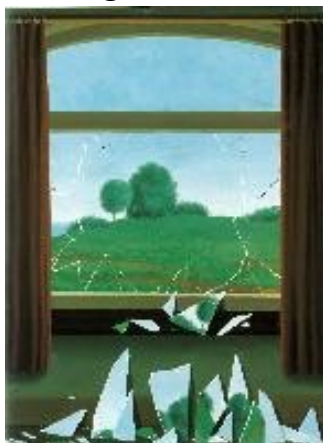
La clau dels camps, 1936 © René Magritte, VEGAP, Barcelona, 2022

El quadre dins del quadre és un tema iconogràfic que, ja en els mestres antics, adopta a vegades un aspecte ambigu. Hereu dels jocs del trompe-l'oeil , en l' obra de Magritte es converteix sempre en darrer terme en una trampa i