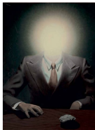
El principi del plaer, 1937. Col·lecció privada.

Magritte també va mostrar una tendència a amagar el rostre. Una manera freqüent de fer-ho és cobrint amb una tela blanca el cap i, de vegades, la figura sencera. El cap cobert s'ha relacionat amb la fascinació primerenca de Magritte per Fantômas , heroi d'una sèrie de novel·les populars, emmascarat amb una mitja al cap i la identitat de qual no és mai revelada, però també s'ha associat amb un esdeveniment de la seva infantesa: el suïcidi de la seva mare, que es va llançar a l'aigua, i la imatge del seu cos rescatat amb el cap cobert per una camisa de dormir.