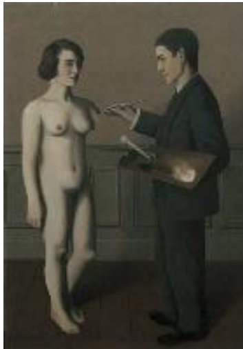
Temptativa de l'impossible , 1928. Toyota Municipal Museum of Art, Toyota, inv. 142. © René Magritte, VEGAP, Barcelona, 2022

A Temptativa de l'impossible (1928), es veu com Magritte està pintant una dona nua. Ell és real i ella només és un producte de la seva imaginació, suspesa entre l'existència i el no-res. És una versió del mite de Pigmalión, de la creació artística identificada amb el desig, del poder de la imaginació per produir la realitat. D'altra banda, en l'obra El llum filosòfic (1936) es produeix la trobada entre dos elements fetitxe del pintor, tots dos dotats de simbolisme sexual, El nas i la pipa ; i en El mag (1951), el pintor apareix utilitzant els seus superpoders per alimentar-se. Completa aquest primer capítol de l'exposició un conjunt d'autoretrats fotogràfics.