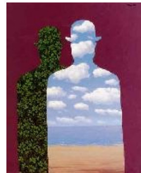
La alta sociedad, 1965 o 1966. © Cortesía de Fundación Telefónica. Cortesía de Ludion Publishers © René Magritte, VEGAP, Barcelona, 2022

La producción de collages y papiers collés no ocupa un gran espacio en el conjunto de la obra de Magritte, aunque su influencia está por todas partes en su pintura y, en consecuencia, a lo largo de toda la exposición. El primer paso del collage es el de recortar, y el recorte genera gran parte de las imágenes de Magritte , creando un mundo tabicado, estratificado, compartimentado, planos que en parte ocultan y en parte revelan otros que están más allá.