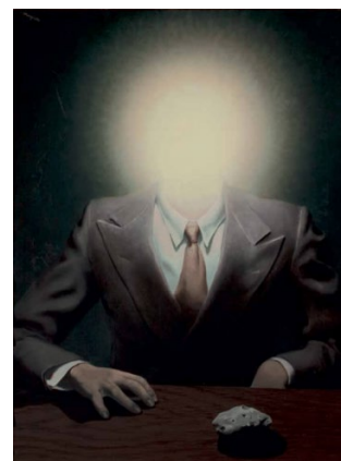
El principio del placer, 1937. Colección privada. © René Magritte, VEGAP, Barcelona, 2022

Magritte también mostró una tendencia a ocultar el rostro. Una forma frecuente de hacerlo es cubriendo con un paño blanco la cabeza y, a veces, la figura entera. La cabeza cubierta se ha relacionado con la fascinación temprana de Magritte por Fantômas, héroe de una serie de novelas populares enmascarado con una media en la cabeza y cuya identidad nunca es revelada, pero también con un suceso de su infancia: el suicidio de su madre al arrojarle al agua y la imagen de su cuerpo rescatado con la cabeza cubierta por un camisón.