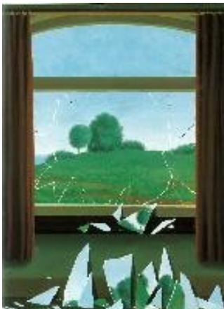
La llave de los campos, 1936

El cuadro dentro del cuadro es un tema iconográfico que, ya en los maestros antiguos, adopta a veces un aspecto ambiguo. Heredero de los juegos del trompe l'oeil , en la obra de Magritte acaba convirtiéndose siempre en una