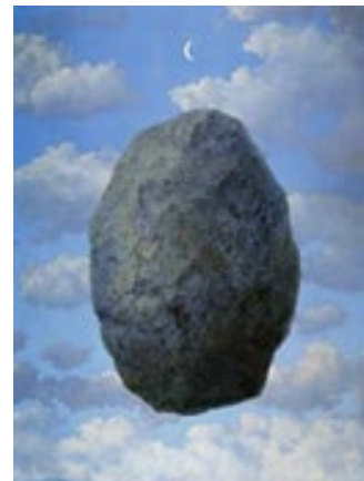
El sentido de las realidades, 1963 © René Magritte, VEGAP, Barcelona, 2022