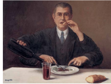
El mago, 1951.. Esther Grether Family Collection. Cortesía de Ludion Publishers © René Magritte, VEGAP, Barcelona, 2022

Este espacio reúne tres de los cuatro autorretratos conocidos de Magritte, en los que explora las posibilidades del artista como mago, al tiempo que sugiere una actitud irónica hacia los mitos relacionados con el genio creador. Magritte no estaba interesado en describir su fisonomía ni en contar su vida a través de estas obras. Sus autorretratos son pretextos para introducir en el cuadro la figura del artista y el proceso de creación.