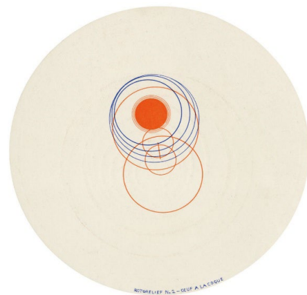
Marcel Duchamp, Rotoreliefs, 1935.

Algunas grandes obras maestras se han hecho célebres precisamente por haber quedado congeladas en una de sus fases. Es el caso de la enigmática El arte de la fuga , que un Johann Sebastian Bach ciego y enfermo dejó detenida abruptamente en el compás 239 poco antes de morir, legando así a varias generaciones de compositores una obra llena de mensajes en clave. Y también es el caso de la tumba de Julio II, que Miguel Ángel nunca pudo concluir. El proyecto, que él llamaba «tragedia de la