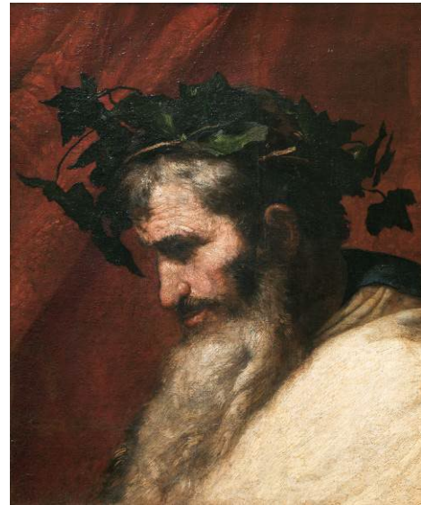
José de Ribera, Detall del cap del déu Bacus, 1636. Oli sobre tela.