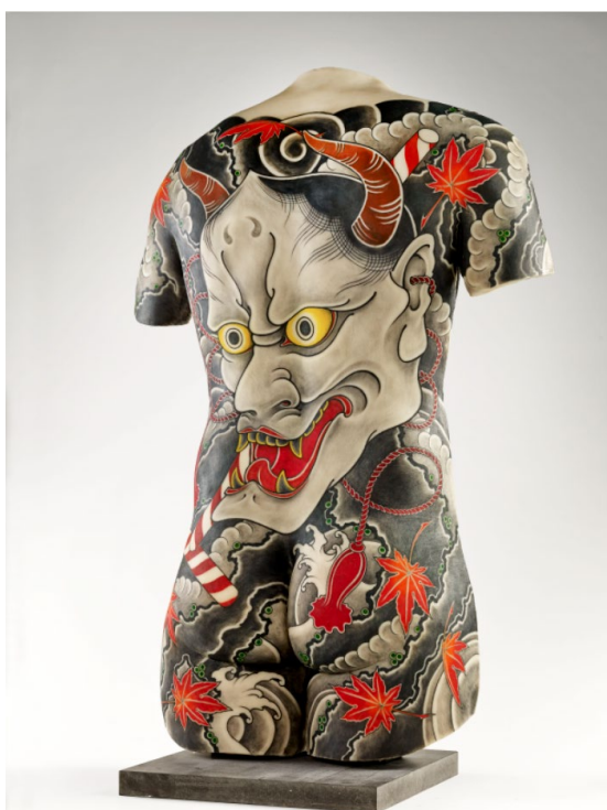
Diseño de tatuaje en una espalda masculina. Filip Leu. Suiza. 2013. Silicona. © Musée du quai Branly – Jacques Chirac.

Cuando el Musée du Quai Branly - Jacques Chirac inició su andadura con esta exposición en París en 2014, invitó a los tatuadores más eminentes del momento a realizar una obra sobre réplicas de silicona de distintas partes del cuerpo. Posteriormente, en cada etapa de su itinerancia por todo el mundo, la muestra se ha ido enriqueciendo con nuevas obras encargadas a tatuadores de distintas nacionalidades, desde tatuajes tradicionales hasta novedosas creaciones.