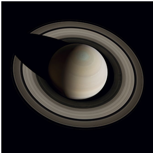
Por encima del polo norte de Saturno, fotografía compuesta en mosaico. Cassini, 10 de octubre de 2013.

Entre los objetivos prioritarios de la Fundación "la Caixa" está el de acercar la cultura, la ciencia y el conocimiento a la sociedad. La divulgación es un instrumento básico para promover el crecimiento de las personas, y por este motivo ambas entidades trabajan para aproximar el conocimiento a públicos de todas las edades y niveles de formación.