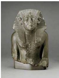
Estatua del faraón Senuseret III

Las excavaciones arqueológicas en la localidad de Tell el-Amarna han sacado a relucir muchos ejemplos de correspondencia diplomática entre gobernantes egipcios y extranjeros sobre tablillas de arcilla. Estaban escritas en cuneiforme, un sistema de escritura empleado para la correspondencia en todo el Próximo Oriente. Las buenas relaciones entre los distintos reinos en muchos casos dependían del intercambio de regalos. Aquí, el rey babilonio Burnaburiash se queja al faraón Akhenaton sobre la cantidad y calidad de los regalos que ha recibido en comparación con los que le ha mandado él a Egipto.