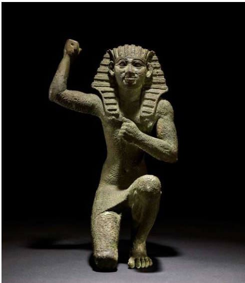
Estatuilla en actitud de júbilo Bronce. c. 664-332 a. C. Egipto.

Faraón. Rey de Egipto explora el simbolismo y el ideario de la monarquía egipcia, al tiempo que intenta desvelar las historias de los objetos y las imágenes que ha dejado como herencia esta antigua civilización.