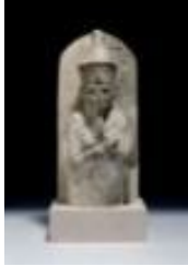
Figura del faraón Mentuhotep II

Caliza. Dinastía XVIII, c. 1550-1295 a. C. Egipto