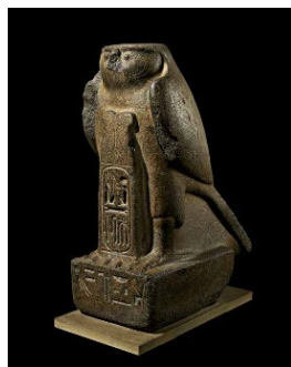
Estatua del dios Re-Horakhty

La corona que lleva este monarca recibe el nombre de "corona blanca". Símbolo del Alto Egipto, solía combinarse con el ureo (cobra erguida), que aquí vemos hábilmente esculpido, en la frente del monarca. Esta cabeza carece de inscripciones, pero el estilo de sus delicados rasgos permite identificar al soberano como Tutmosis III. Su próspero reinado también se refleja en la gran calidad de las esculturas producidas en los talleres reales. Este tipo de estatuas se colocaba en los templos ara reforzar los vínculos entre el monarca y lo divino.