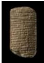
Tablilla con el texto de una misiva de un rey babilonio en escritura cuneiforme

las ofrendas diarias a los dioses. Todo ello se describe en la larga inscripción jeroglífica de la parte frontal de la estatua, en la que Sennefer solicita que, una vez muerto, se le hagan ofrendas funerarias.