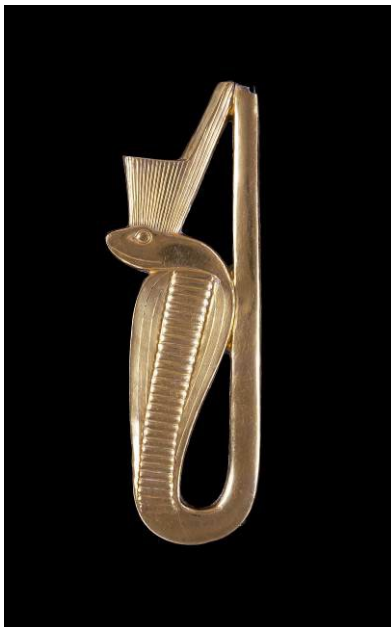
Elemento decorativo para muebles en forma de ureo Oro. Baja Época, c. 664-332 a. C. Egipto

Al margen de su origen, o de que fueran hombres o mujeres, los monarcas egipcios se definían mediante la adopción de símbolos reales. Así, por ejemplo, inscribían sus nombres en cartuchos, o llevaban en la frente el ureo, una figura de cobra erguida. Si bien algunos faraones fueron objeto de veneración —como