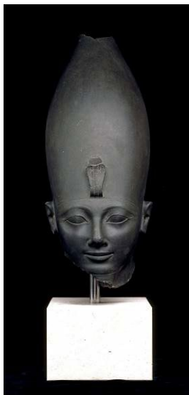
Cabeza del faraón Tutmosis III

Limolita verde. Dinastía XVIII, reinado de Tutmosis III, c. 1479-1425 a. C. Karnak, Tebas, Egipto