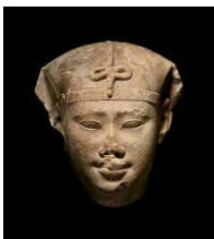
Cabeza de Alejandro Magno

Caliza. Dinastía Ptolemaica, c. 305-30 a. C. Egipto