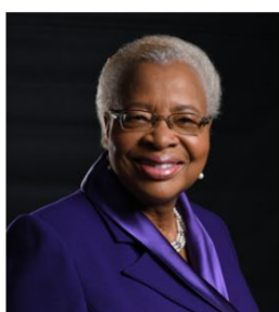
Graça Machel Fundadora de Graça Machel Trust. Fundadora de Foundation for Community Development