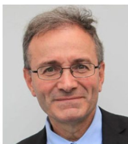
Vincent Cochetel Enviat Especial per a la Situació del Mediterrani Central i Occidental UNHCR