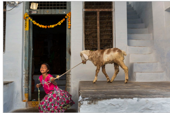
Una nena juga amb un xai a Bukaraya Samudram durant la festivitat del Teru.

La mostra aprofundeix en el més sensible i màgic del món femení, com també en la força i la capacitat de superació de les dones d'Anantapur. La fotografia s'hi ha apropat amb un respecte reverencial. Obstinada i desmesurada, García Rodero ha sabut submergir-se en aquest món i fondre's en l'alegria i el patiment de les persones que encobreixen amb color i distinció els claroscurs de la seva pròpia existència.