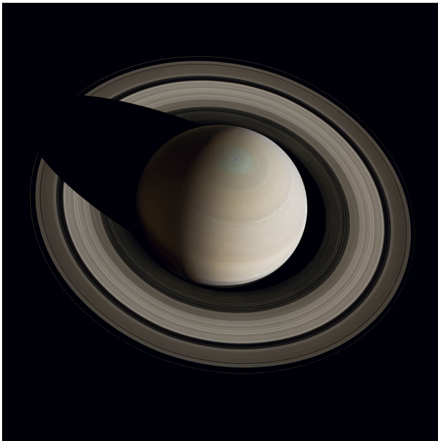
Por encima del polo norte de Saturno, fotografía compuesta en mosaico. Cassini, 10 de octubre de 2013.