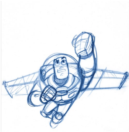
Bob Pauley, Buzz , Toy Story. 1995. Lápiz sobre papel © Pixar

Pixar. Construyendo personajes , en cambio, presenta un nuevo enfoque que se centra en el primer proceso de desarrollo de los personajes, desde la génesis. La exposición demuestra que los personajes de Pixar son el resultado de un cuidadoso y riguroso trabajo creativo tras un profundo trabajo de investigación. De esta forma, adentra al espectador en las bambalinas creativas de una gran factoría de ficción, como es Pixar.